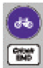
Koniec drogi dla rowerów