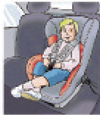
Foteliki mocowane przodem do kierunku jazdy

Przybliżony przedział wiekowy: od urodzenia do 12-15 miesięcy